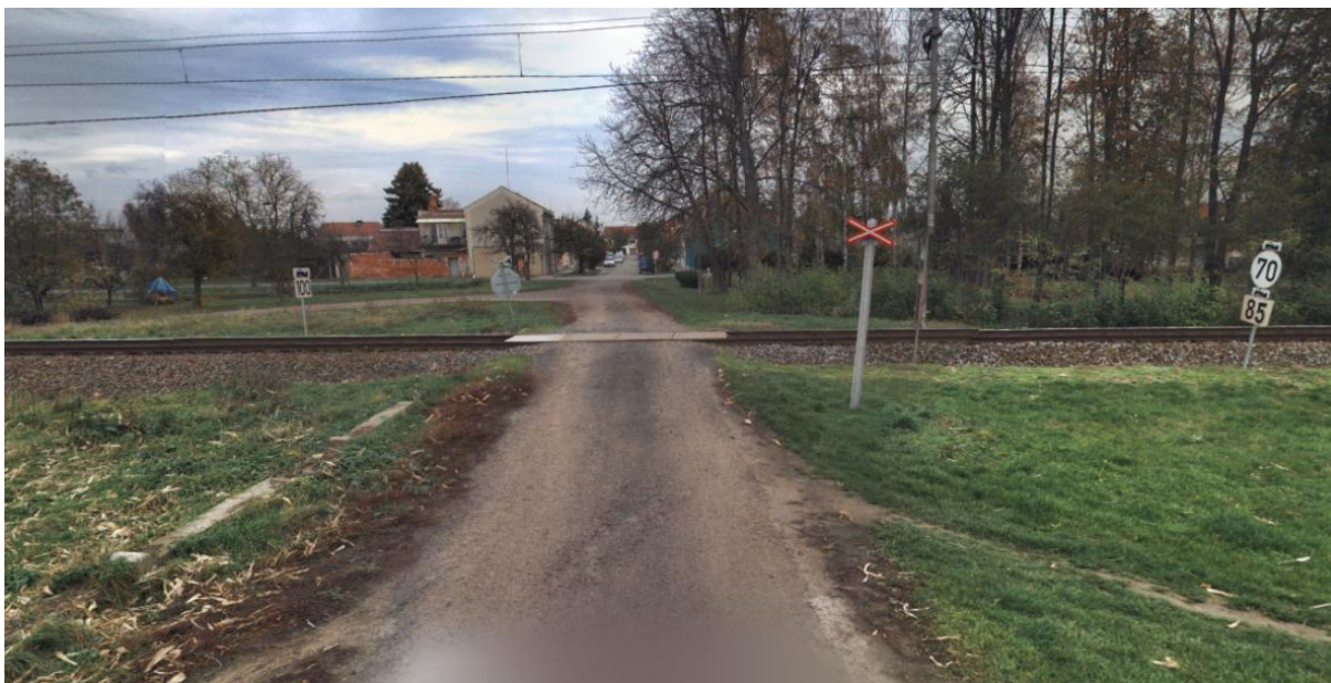
Obr. 2. PZS v km 76,881 (P7584)